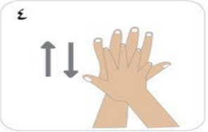
٤ باطن اليد اليمنى على ظهر اليد اليسرى مع تداخل الأصابع والعكس