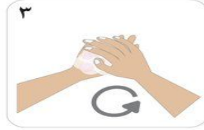
٣ باطن اليد بباطن اليد الأخرى