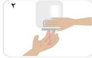
٢ ضع كمية من الصابون بحيث تغطي سطح اليد