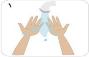
١ بلل يدك بالماء

أغسل يديك في حالة الإتساخ الظاهري ودلكها من أجل نظافة الأيدي الزمن الكلي للإجراء من ٤٠-٦٠ ثانية