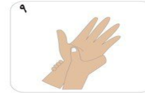
٩ فرك كامل الرسغ مع الجانب المعاكس