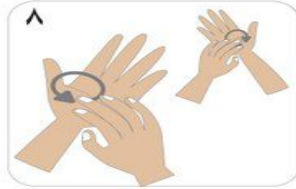
٨ الدلك الدائري للأمام والخلف بأصابع اليد اليمنى لباطن اليد اليسرى والعكس