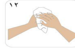
١٢ تجفيف اليدين باستخدام فوطة نظيفة أحادية الاستخدام