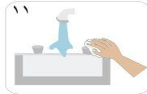
١١ أغلق المياه باستخدام فوطة نظيفة أحادية الاستخدام