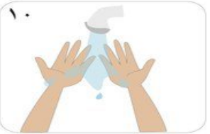
١٠ شطف اليدين بماء جاري